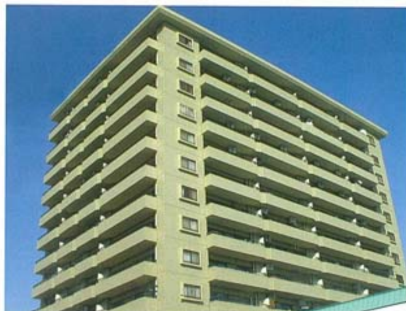
レーベンハイム・ロウ南熊本 (熊本)