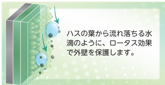
ビーズコートシリーズのメカニズム