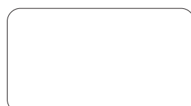
↑オーシャンブルー(特紺)