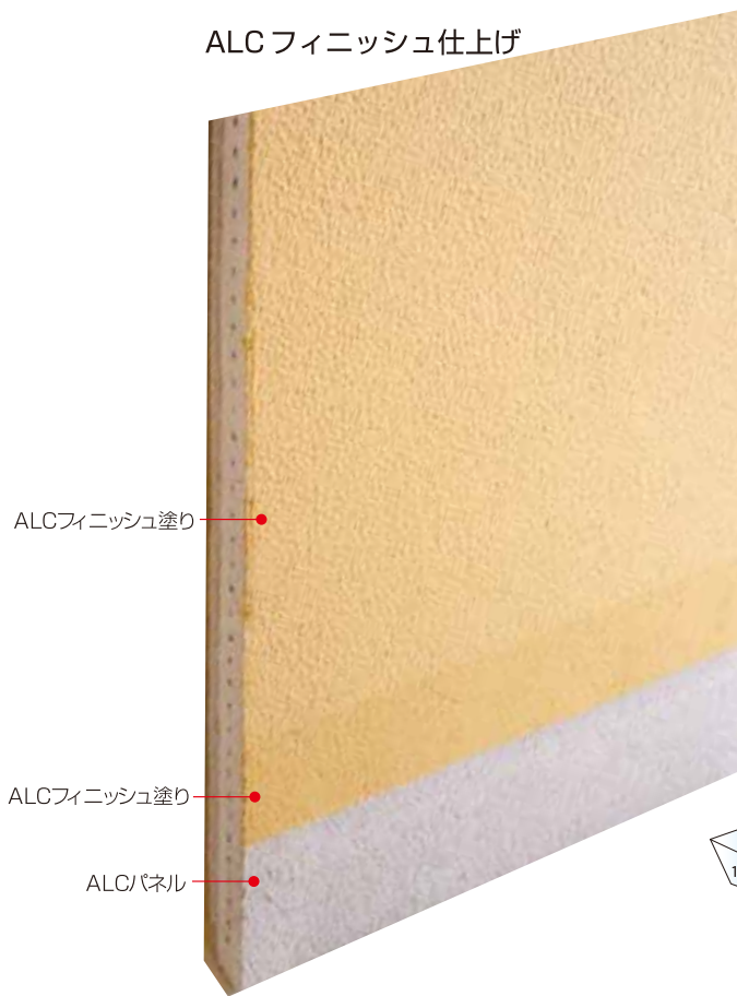
ALCフィニッシュ仕上げ